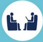
ارزیابی سلامت روان